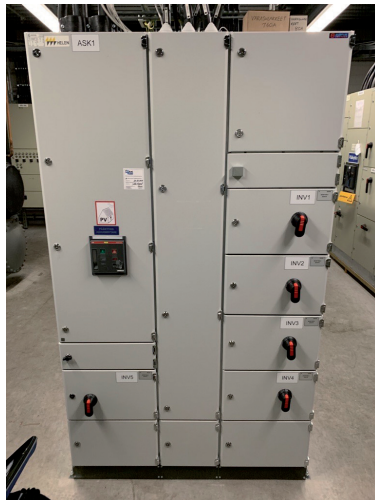
Kuva 1. Aurinkosähkökeskus