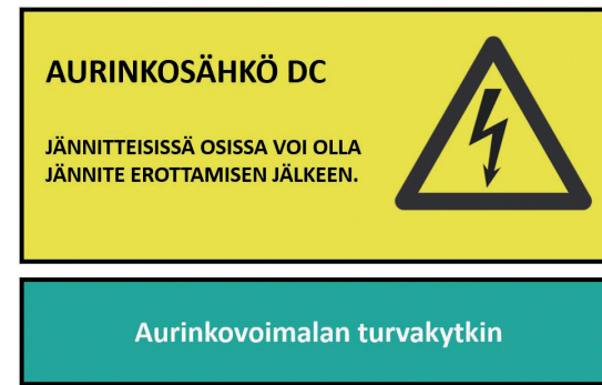
Kuva 3. Kenttäkoteloiden tai turvakytkimien merkintä katolla.